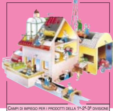
CAMPI DI IMPIEGO PER I PRODOTTI DELLA 1ª-2ª-3ª DIVISIONE