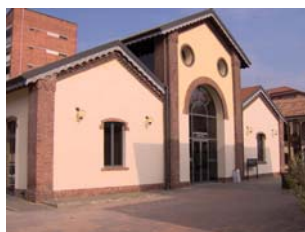
Società Consortile Sala Contrattazione Merci (Mortara - PV)