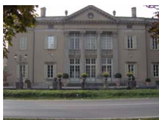
Palazzo Gambarini-Giavazzi Sede Municipio (Verdello - BG)