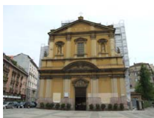
Chiesa di Santa Francesca Romana (Milano)

<vedi anche www.domodry.it - Sezione “CLIENTI” >