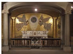
Cripta del Santuario della Madonna delle Lacrime (Treviglio - BG)