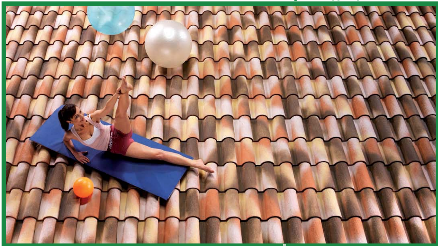
tegola a coppo tipo a mano emiliana

per l'acqua piovana, mentre la parte convessa, appositamente più arcuata rispetto alle semplici tegole portoghe-