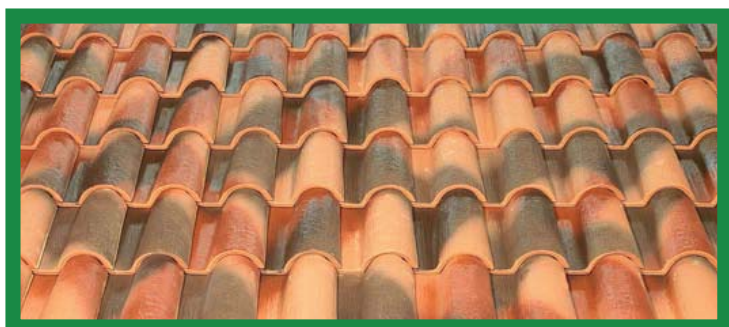
tegola a coppo tipo a mano piemonte antico